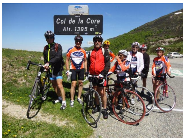
Col de Pailhères avec les chevaux